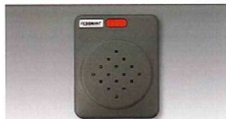
かくにん君 KMK-810シリーズ